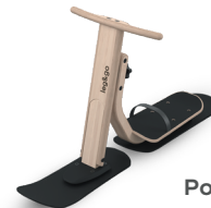
Polar Bike 2 bis 6 Jahre