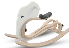
Rocking Elephant (Schaukeltier) - 6 bis 18 Monate