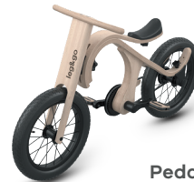
Pedal Bike (Kinderfahrrad) - 3 bis 6 Jahre