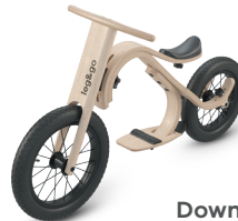
Downhill Bike 2 bis 5 Jahre