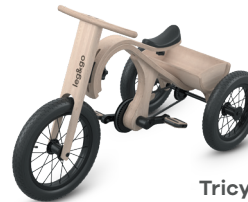
Tricycle (Dreirad) - 2 bis 4 Jahre